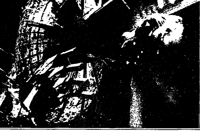
لقطة من فيلم مفقود في الفضاء

نجم المسلسلات هوروس ويلينغز بعد ان استهلك فكرة ملمستيون، وهو لمان كان يخفيها واحدا في جيبه.. فالأفلام